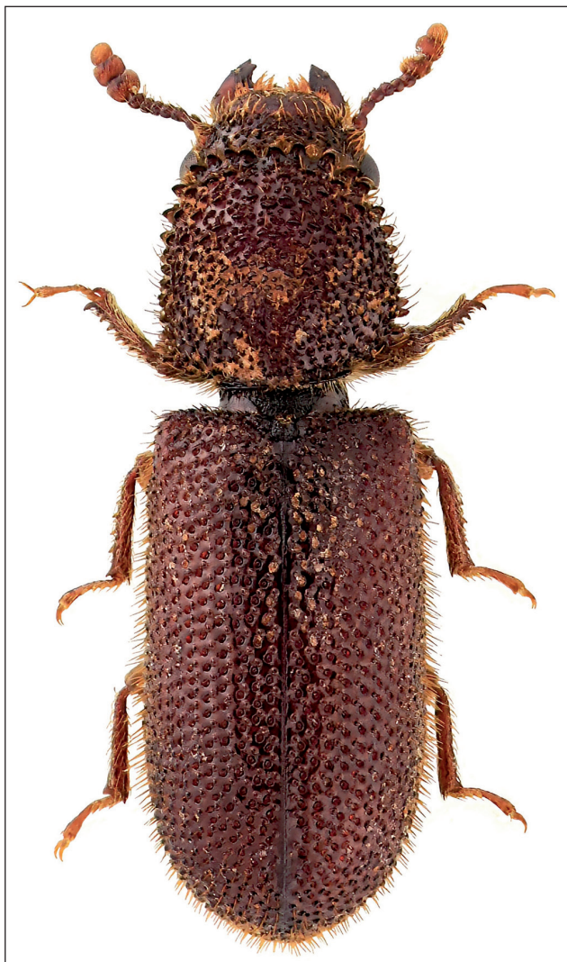
Obr. 1. Korovník Stephanopachys substriatus (Paykull, 1800) z Hostýnských vrchů; délka těla 3,9 mm (fotografie V. Mihal). Fig. 1. Horned powder-post beetle Stephanopachys substriatus (Paykull, 1800) from the Hostýnské hills; body length 3.9 mm (photograph V. Mihal).

mi brzy po požáru. Typický vývoj larev probíhá u báze kmene a jejich výskyt bývá omezen na zuhelnatělé části kůry, kde teplo lesního požáru poškodilo lýkovou vrstvu (ILMONEN et al. 2001; EHNSTRÖM & AXELSSON 2002). ECKELT et al. (2018) jej označují za jeden z reliktních druhů pralesů střední Evropy, proto může být považován za deštníkový druh pro ochranu zbytků pralesních ekosystémů.