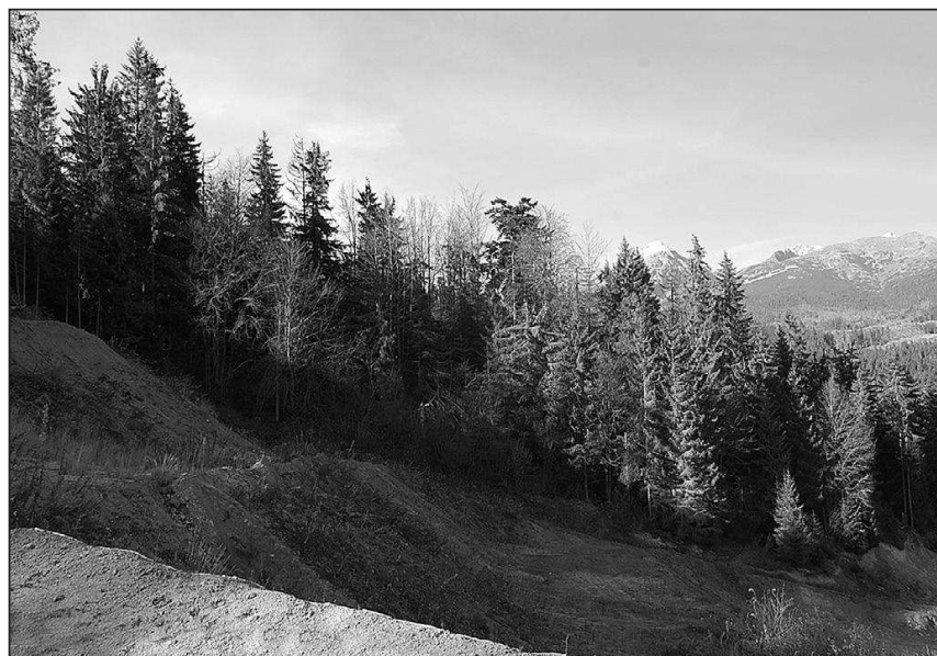
Obr. 2: Pohľad z lomu na dokumentovaný bukový porast (28. 10. 2010). Fig. 2: View of the documented beech stand from the quarry (28. 10. 2010).

Pri ploche vľavo: Athyrium filix-femina , Dryopteris carthusiana . Nižšie pod hrebienkom,